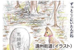
遠州街道(イラスト)