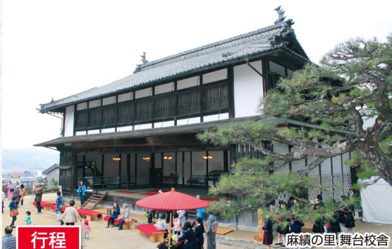
麻績の里 舞台校舎