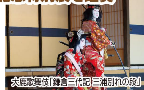
大鹿歌舞伎「鎌倉三代記」三浦別れの段