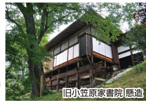
旧小笠原家書院 懸造