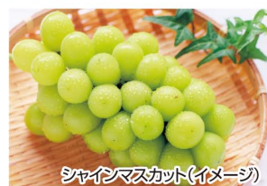
シャインマスカット(イメージ)