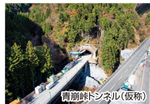
青崩峠トンネル(仮称)