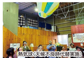
熱気球(天候不良時代替実施)

動きやすい服装でお越しください(長袖長ズボン、運動靴/スカート、サンダルNG)。アウトドアアクティビティの性質上汚れる可能性があります。天候や風の関係により、体験開始後もフライト中止も含めてスケジュールは変動します。グローブまたは軍手をお持ちください。有事の際に備え保険証をお持ちください。