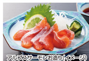
アルプスサーモンお造り(イメージ)